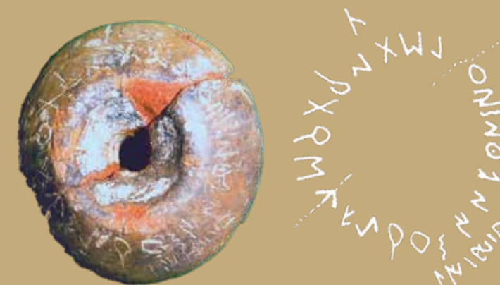
Probable inscripció dedicatòria:

"AQUESTA FUSAIOLA HA ESTAT FETA PER ATARSU PER A SINEKUN"