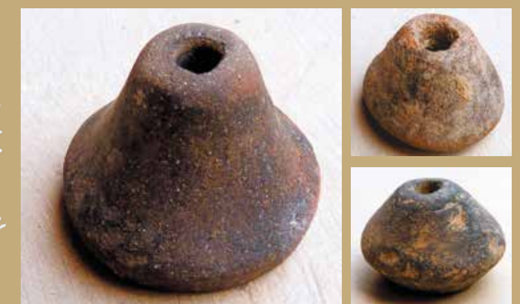
Fusaioles del Vilar.