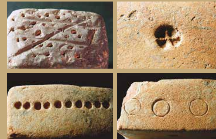
Marques aparegudes als ponders del Vilar.

Les úniques parts que es conserven dels fusos manuals utilitzats per al filat són les fusaioles. El fus era un bastonet de fusta amb una mossa a l'extrem superior per subjectar-hi el fil i, a l'extrem inferior, la fusaiola, que amb el seu pes i forma circular facilitava el moviment giratori i, d'aquesta manera, el torçat i estirament de les fibres per formar el fil.