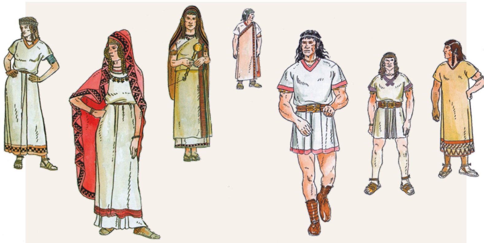
La indumentària més habitual utilitzada pels ibers. Il·lustracions de Francesc Riart Jou.

S'han estudiat cinc fusaiols del Vilar, la més excepcional de les quals presenta una inscripció dedicatòria. Aquesta extraordinària peça, avui en una col·lecció particular, presenta una línia completa de 22 signes conservats en el con superior i una seqüència de 6 signes a sota. El text es va gravar abans de la seva cuita. Es tracta d'una dedicatòria destinada a un regal.