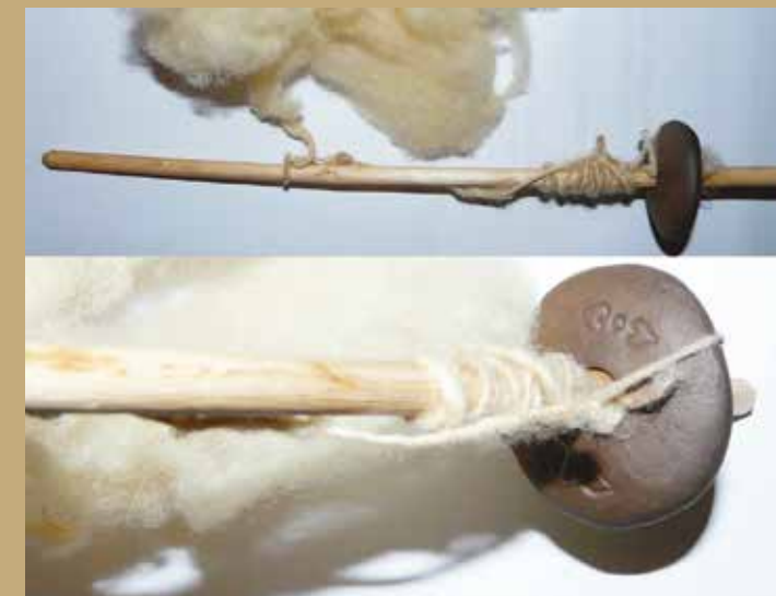
Exemple de l'emmanegament i funcionament d'una fusaiola.