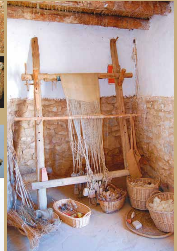
Reconstrucció d'un telar vertical a la Ciutadella Ibèrica de Calafell.