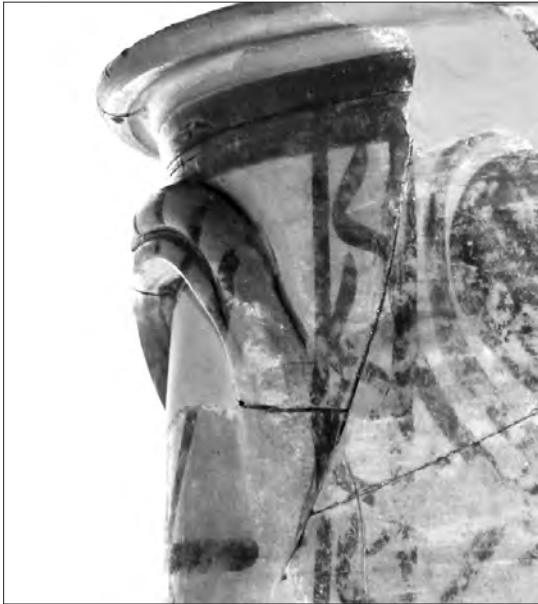
Figura 2. Detall de la nansa d'un càlat.

Una altra característica força peculiar d'aquests recipients ceràmics és el fet que les nanses, quan en duen, responen a una mera intenció decorativa, no pas a una finalitat funcional, ja que estan col·locades sempre en posició horitzontal, i no són útils per subjectar la peça (figura 2). Tal com va fer constar Maria Josep Conde (1990, 233), l'existència o no de nansa en els càlats, així com el tipus utilitzat, varia en funció de l'esquema decoratiu.