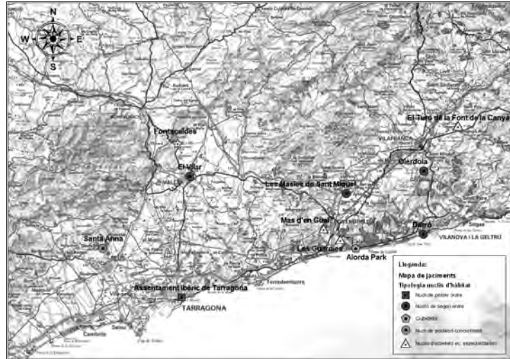
Figura 3. Mapa de tots els jaciments citats en aquest treball.

període (Lafuente 1989; Solé 1996; 1997; Fabra et al. 2003; Fabra i Solé 2004; Fabra et al. 2008; Burguete 2004, 2012a, 2012b). Es troba ubicat a 5 quilòmetres al nord / nord-oest de la ciutat de Valls, al paratge conegut com la Coma, a uns 400 metres sobre el nivell del mar (en endavant, msnm). Aquesta ubicació, en els darrers estreps de la serralada Prelitoral, situa el jaciment en un emplaçament privilegiat pel que fa als recursos naturals, cosa que el converteix en un lloc propici per a l'establiment d'un centre productor de ceràmica.