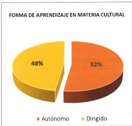
Figura 6. Los porcentajes de visitas autónomas y dirigidas son muy parecidos.