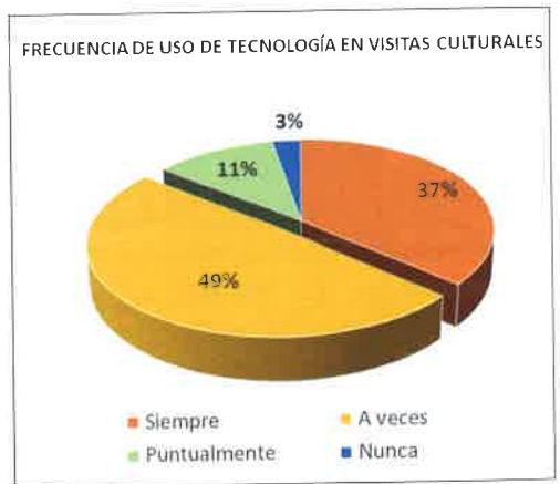
Figura 4. Un 97% usa la tecnología para informarse.