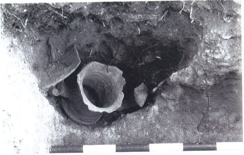
Figura 2. Excavación en una zanja de gas natural (1995).