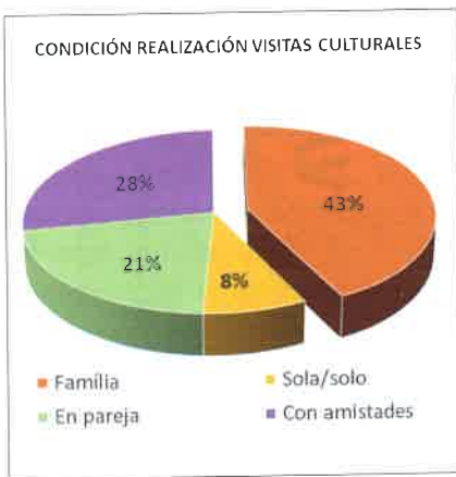
Figura 3. Un 92% realiza visitas culturales en compañía.