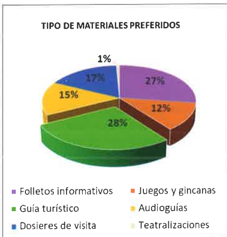
Figura 7. La ruta turística (28%) y los folletos informativos (27%) son las opciones favoritas.