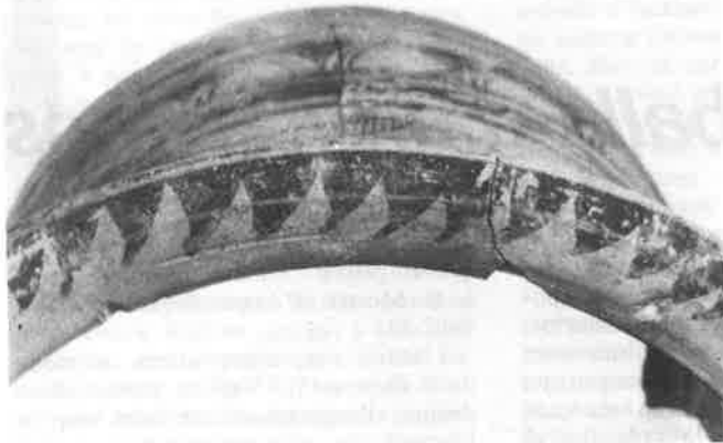
Detall del vorell, amb pintura de "dents de llop". (Foto Burguete).