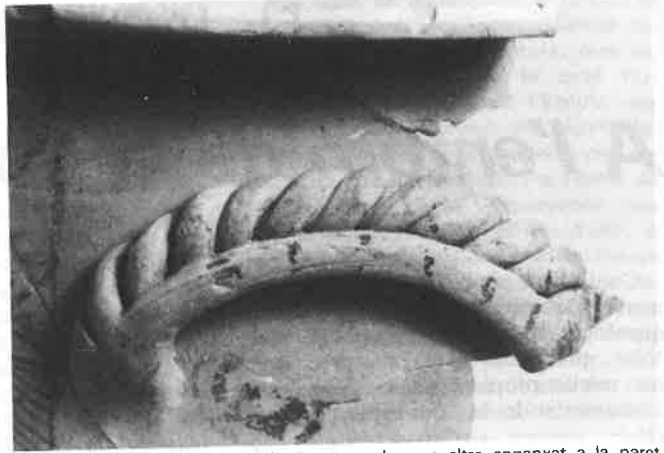
Detall de la nansa. Dos marrells trenats, sobre un altre enganxat a la paret de l'atuell.

greixant molt fi de mica daurada i platejada amb algunes partícules de calç.