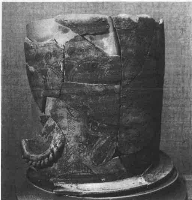
El kalathos, abans d'ésser netejat i restaurat. S'hi pot veure la inscristació de calç i el suport de cartró. (Foto Queralt).