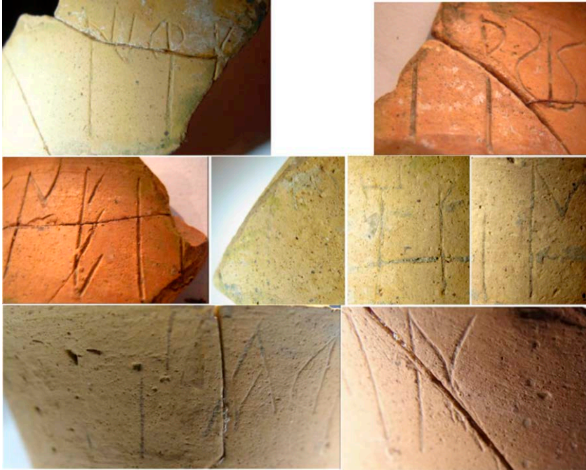
Fig. 3: Fotografies de detall de la primera inscripció.

del plom F.9.5 d'Orlell, on ife apareix aïllat com a primer segment davant bodotaś que s'interpreta habitualment com un antropònim (Fletcher 1981: 67; Faria 1990-1991: 85; Rodríguez Ramos 2014: 146), tot i que podria no ser-ho (Untermann 1990: 221, nota 48; Ferrer i Jané 2006: Annex 4). En tot cas, de confirmar-se el seu ús davant antropònims, caldria estendre l'abast de l'esquema als antropònims: ife + {N / NP}. A aquesta relació caldria afegir ara el cas ife + [bi]dia d'aquest vas, tot i que cal tenir en compte que potser l'element determinat per ife sigui [bi]diabene . En d'altres casos podria actuar com a pronom, com sembla ser el cas del text bas + sumi + dadin + ife d'una ceràmica pintada (F.13.5) de Llúria, on apareix com a darrer element del text, integrat en una possible forma verbal (Silgo 1996: 304; Orduña 2006: 195). Menys clar és el seu ús a la gerreta de La Joncosa barete + ife + oskaistire (D.18.1).