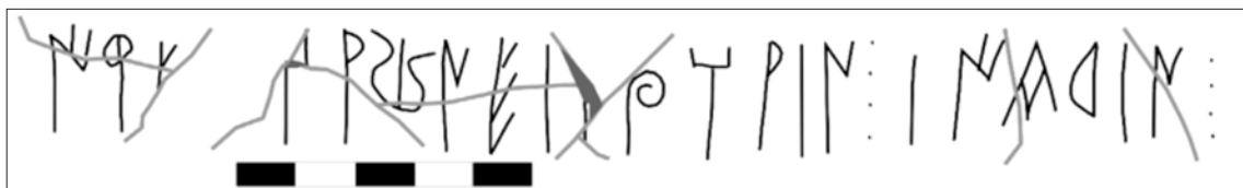
Fig. 2: Dibuix de la primera inscripció.

difuminada a causa probablement de l'erosió postdeposicional un cop trencat el vas, de forma que, mentre la meitat de la inscripció restava protegida, l'altre meitat restava exposada. Potser també hi podria haver influït el procés de neteja a què molt probablement va ser sotmès en el primer procés de reconstrucció, per eliminar la concreció que el devia recobrir en gran part. De fet, en aquesta zona són les restes de concreció les que permeten resseguir els traços originals.