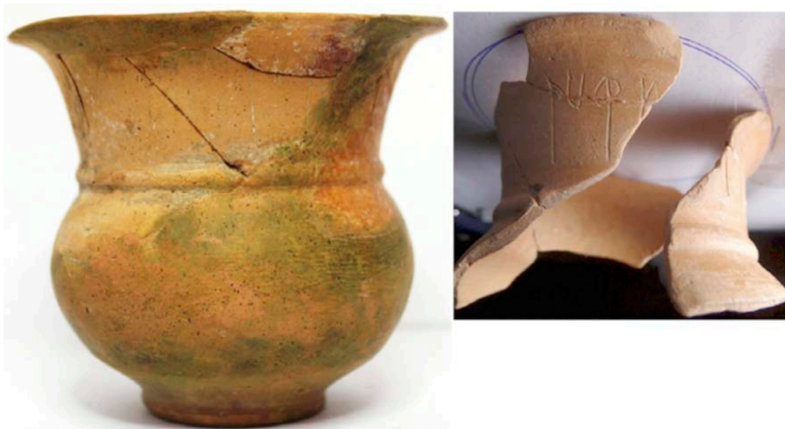
Fig. 1: Primer vas. Esquerra: estat en ser adquirit. Dreta: estat actual.

La inscripció consta de restes de 21 signes, més un signe perdut, corresponents a l'escriptura ibèrica nord-oriental i està realitzada abans de la cocció a la meitat superior de la paret externa del vas amb signes d'uns 2 cm d'alçada (fig. 2). La segona meitat del text està molt