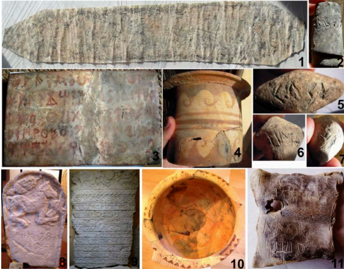
Fig. 12: Altres falsos del museu de Figuerola.

càlat (fig. 12, 4); així com tres glands de plom, dos d'ells amb llegendes monetals (fig. 12, 5, 6 i 7). Com a curiositat, cal indicar que les dues inscripcions pintades de la fig. 11 van ser adquirides a la casa de subhastes Royal Athena el 2012, tot i que catalogades com a cel·tibèriques, i encara es poden consultar a la web i als catàlegs on-line 2 .