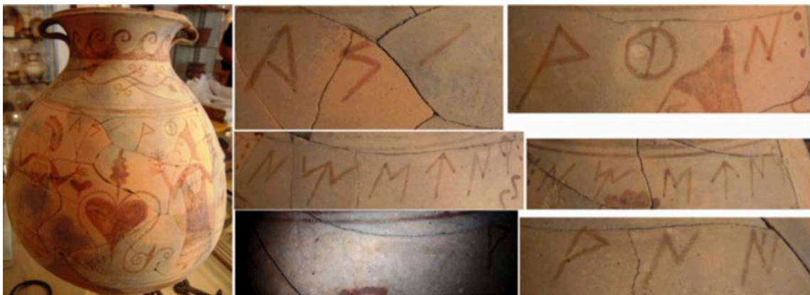
Fig. 10: Fotografies de la inscripció falsa ja publicada.

tota la inscripció. La lectura de l' editio princeps es pot corregir, atès que el signe que es llegia ki és estrictament un signe a d'estil sud-oriental tot i que en el límit també podria ser un signe ka1 amb els traç central unint els laterals o un signe a nord-oriental mal traçat. Davant del fragment ani hi ha un espai amb els signes quasi esborrats no reflectits a editio princeps , però que encara són visibles, amb seguretat un signe s5 i potser un signe ti1 de tres traços. També s'aprecien bé els tres punts que separen aquest segment de l'anterior. Després d'aquest segment