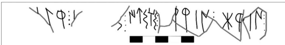
Fig. 5: Dibuix de la segona inscripció.

signe ta , podria ser indicatiu que aquest és el punt d'inici de lectura. Els cinc fragments d'inscripció són (fig. 6): (1) +gír · + , (2) s · iusdis · , (3) arban · , (4) · taf · , i (5) +ban · .