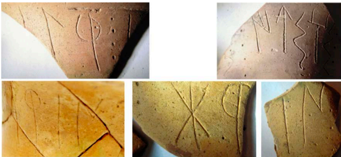
Fig. 6: Fotografies de detall de la segona inscripció.

un signe elevat. Si el traç fos complet, podria ser també ba i o . No sembla possible reconstruir un signe e , ja que quedaria massa enganxat al signe posterior. El signe ki està fragmentat en la seva meitat inferior, però no pot ser un altre signe, ja que l'alternativa de llegir un signe l2 , no encaixaria amb el fet que el signe següent és un signe f . El signe final d'aquest fragment només és visible un traç vertical aïllat que podria correspondre a un signe ba1 o potser a un signe o . No sembla probable que fos e4 , atès que aleshores hauria de ser visible el traç superior, tot i que sí que podria ser un e2 . Tampoc seria plausible que fos un signe ti4 , ja que amb l'espai disponible a la dreta haurien de ser visibles els altres traços d'aquest signe, però sí que podria ser un ti de dos traços o un to de dos traços en posició elevada. El final d'aquest segment no encaixa directament amb cap altre, però, probablement hi hagi com a mínim un parell de signes perduts: · +[- -]s · .