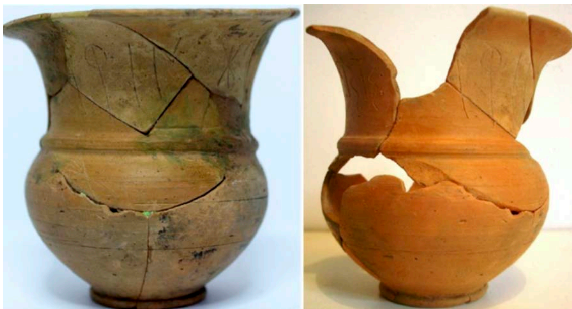
Fig. 4: Segon vas. Esquerra: estat en ser adquirit. Dreta: estat actual.