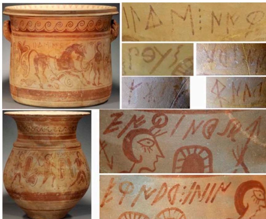
Fig. 11: Inscripcions pintades falses de Royal Athena.

hi ha un espai sense signes i on la decoració interromp l'espai del text, cosa que marca l'inici del text. Així doncs, la lectura restaria askeaten · nm̄sun̄f̄ · nm̄sun̄f̄ke · tisani .