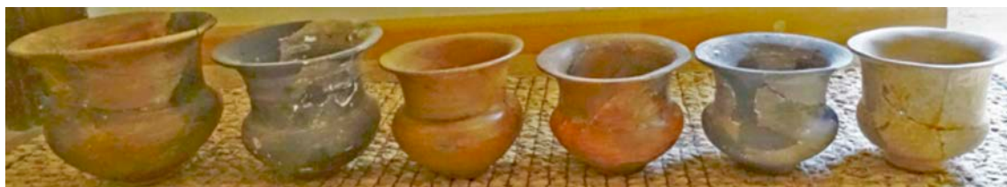
Fig. 7: Altres vasos caliciformes suposadament procedents del mateix jaciment.

s'usarien en libacions rituals que acabarien dipositats com a ofrena a la divinitat. Els vasos moltes vegades apareixen sencers, però en d'altres apareixen fragmentats aparentment de forma intencionada. Geogràficament (fig. 8), aquests tipus de vasos es distribueixen per tot el territori ibèric, tot i que la zona de màxima concentració de troballes és dona a la zona contestana i edetana (González-Alcalde 2009). Són especialment freqüents en coves santuari, però també en santuaris de superfície i necròpolis. A Catalunya les dues úniques coves-santuari identificades amb vasos caliciformes són la cova de La Font Major (L'Espluga de Francolí), punt 2 del mapa de la fig.8, d'on procedeixen dues inscripcions ibèriques (Rauret 1962), una de les quals encara inèdita, i L'Avenc del Gegant (Sitges), punt 1 del mapa de la fig. 8.